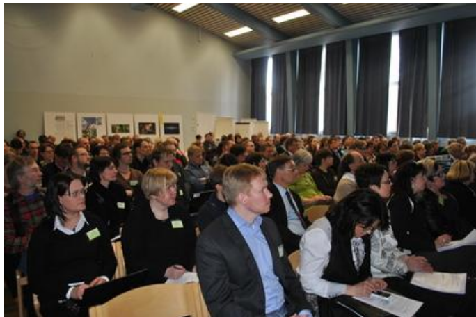
Nätverksträffen och Uusitalos avskedsfest drog fullt hus.