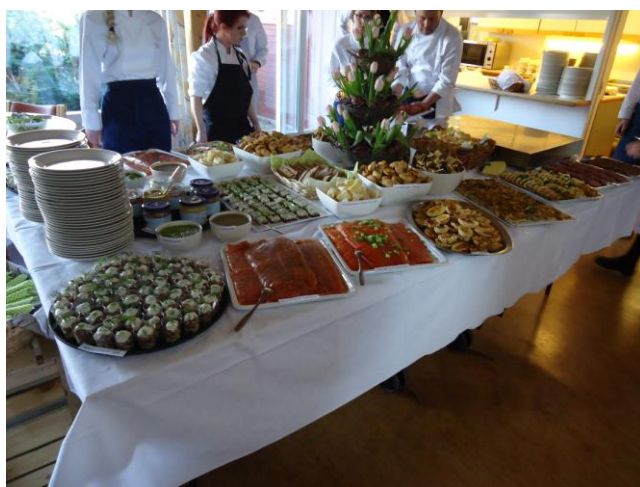
Buffé av åländska produkter.

Trenden med närproducerade produkter har nu nått Åland på många olika nivåer, vilket visades av det stora intresset för åländska produkter på matmässan Närproducerat Åland som arrangerades av Ny Nordisk Mat på Åland 18.4. Under mässan visade 25 livsmedelsproducenter upp sina produkter för ca 140 representanter från restauranger, storkök, butiker och logistikföretag. Gästerna var mycket intresserade av det stora utbud av åländska produkter som finns, och också de större logistikföretagen visade ett stort intresse för de åländska produkterna.