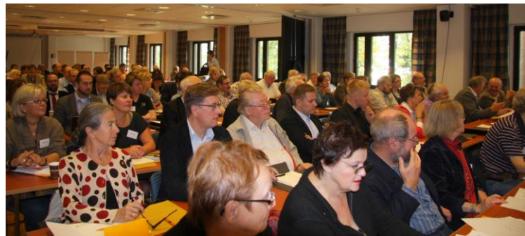
Arkivbild: Landsbygdsriksdagen 2010 med närdemokratitema. Foto: Ritva Pihlaja

Den representativa demokratin är inkapabel att ta hänsyn till de planerade storkommunernas geografiska mångsidighet. Det behövs närdemokrati, men det finns emellertid olika tolkningar av närdemokratins karaktär. Byaverksamhetens nationella representanter talar om